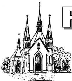
St.Mariä Heimsuchung Hehn